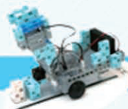
レベル3 アーム付き搬送ロボット