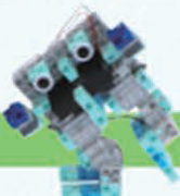
レベル6 2足歩行ロボット