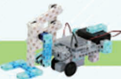
レベル5 フォークリフト