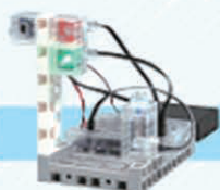
レベル1 信号機をつくろう