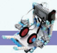
レベル11 お絵かきロボット