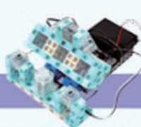
レベル10 音と光のリズムゲーム