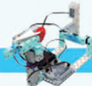
レベル4 紙飛行機発射ロボット