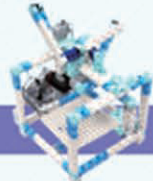
レベル12 ブロックキャッチャー