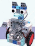
レベル9 ペットロボット