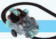
レベル2 ライトレース自動車